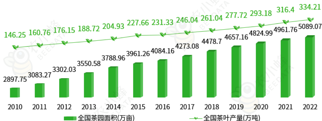
图表 1：中国茶园面积与茶叶产量变化趋势

据国家统计局数据显示，2010 年以来，在 market 需求的驱动以及“果菜茶”多样化发展相关政策的扶持下，中国茶园面积与茶叶产量均呈现逐年增长态势。