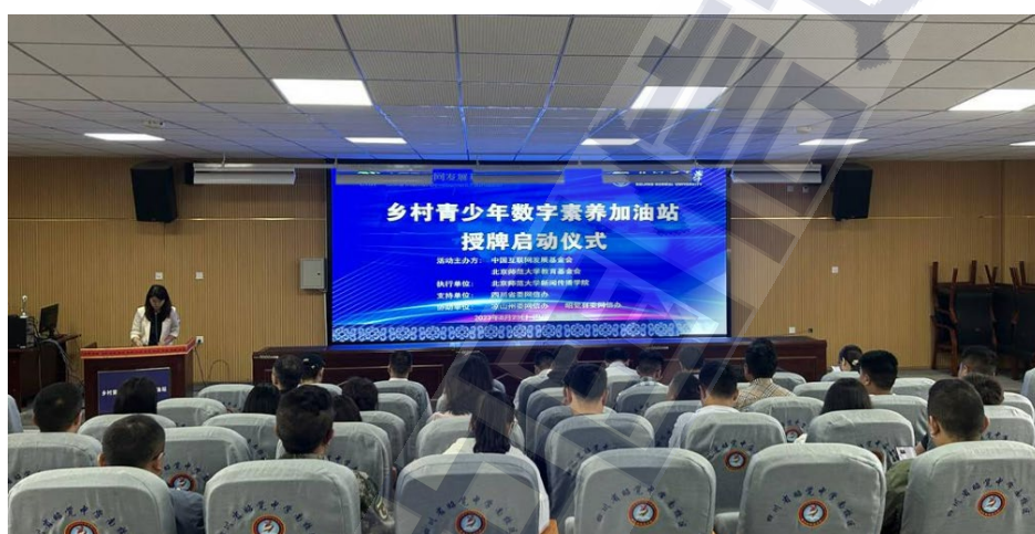
图 9 四川省乡村青少年数字加油站启动仪式

凉山州等民族地区的 13 所中小学校入选。该项目计划资助国家乡村振兴重点帮扶县的部分中小学建立数字素养加油站，配备数字阅读设备、科技素养图书、数字电视、VR 眼镜等硬件设施。同时，组织大学生志愿者与受助学校中小學生“手拉手、结对子”，共同开展“共筑网络强国梦”主题实践活动，指导青少年文明用网、文明上网，不断提升青少年数字素养与技能。