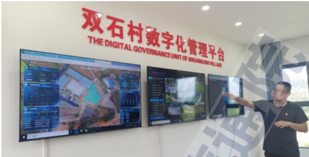
图4 双石村数字化管理平台