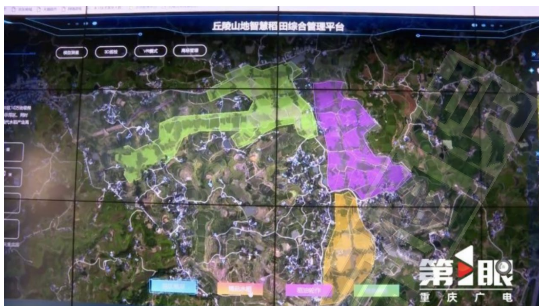
图 6 丘陵山地智慧稻田综合管理平台