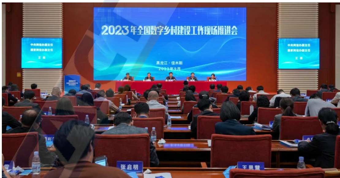
图 1 2023 年全国数字乡村建设工作现场推进会

9月20日，2023年全国数字乡村建设工作现场推进会在黑龙江省佳木斯市召开，中央网信办副主任、国家网信办副主任王崧出席会议并讲话。会议强调，实施数字乡村战略五年来取得积极成效，但仍然面临不少问题和挑战。要锚定目标任务，坚持夯实基础和拓展应用，坚持需求牵引和问题导向，坚持整体推进和重点突破，坚持政府引导和市场主导，扎实推进数字乡村建设工作再上新台阶。下一步，要认真落实党中央、国务院决策部署，强化统筹协调、抓好监测评价，深化试点示范、突出标准引领，注重区域协作、构建合作生态，加强宣传引导、营造良好环境，确保数字乡村建设工作落到实处。