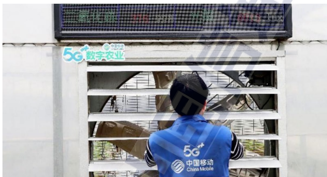
图7 移动人在系统后台查看瓜田数据信息

动江苏公司通过移动信息化技术赋能，对棚内空气和土壤的温湿度、二氧化碳等种植环境进行实时监测，5G智慧浇灌系统根据大棚温湿度和瓜苗成长情况，可以实现自动浇灌，为瓜苗培育创造良好生长环境。对棚内水泵、风机、遮阳棚的自动控制，让西瓜种植越来越智能化、自主化，实现了种植户的增产增收。