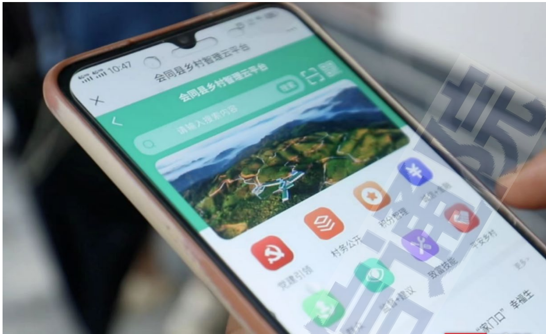
图 5 会同县乡村治理云平台微信小程序一览