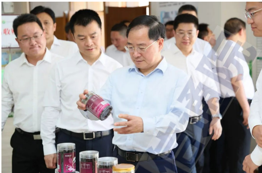
图2 金壮龙调研数字乡村建设情况