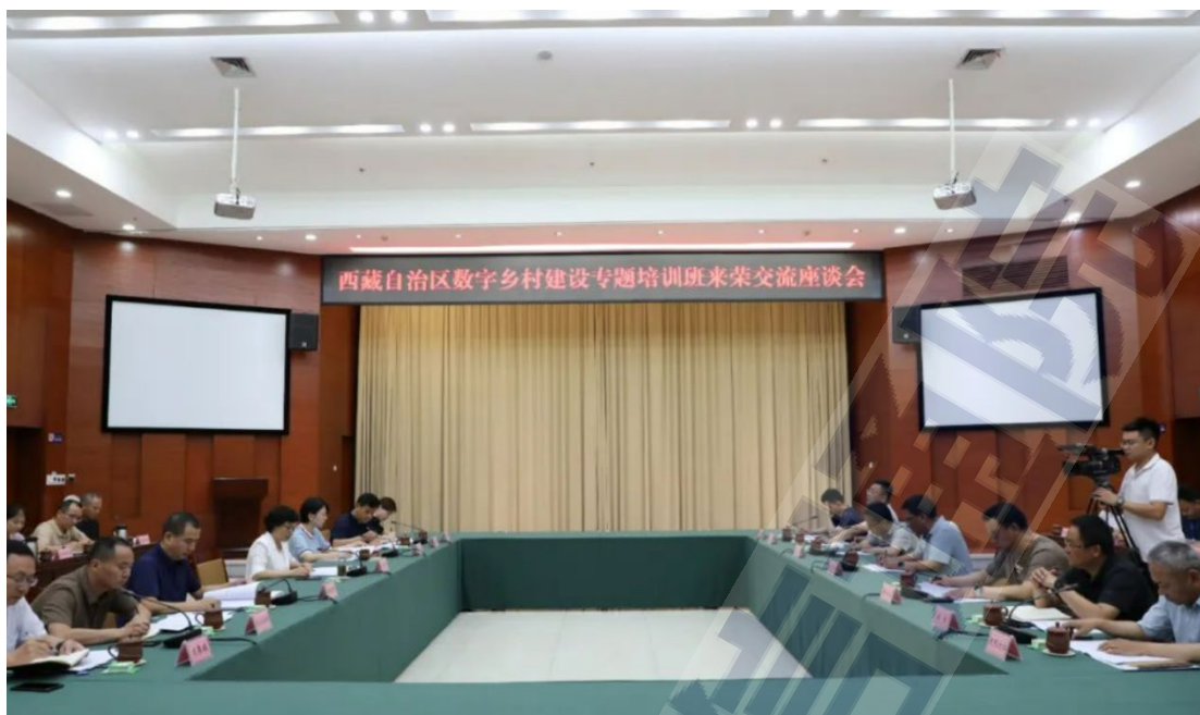
图3 西藏自治区数字乡村建设专题培训班在重庆市荣昌区开展座谈会