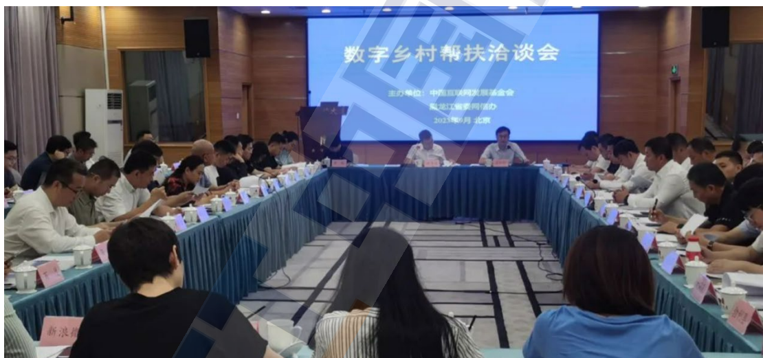
图8 数字乡村建设帮扶洽谈会现场

9月1日，“数字乡村建设帮扶洽谈会”在京召开，该活动由中国互联网发展基金会、黑龙江省委网信办主办。会上，黑龙江省数字乡村重点县围绕网信工作特点，发布了公益项目帮扶需求，介绍了所在县的营商环境、资源优势、政策支持等情况。与会社会组织、企业代表围绕数字文旅、数字气象、村级组织数字治理、农产电商等方面介绍各自协会、企业情况，表达了与黑龙江达成数字乡村建设帮扶的意向和信心。