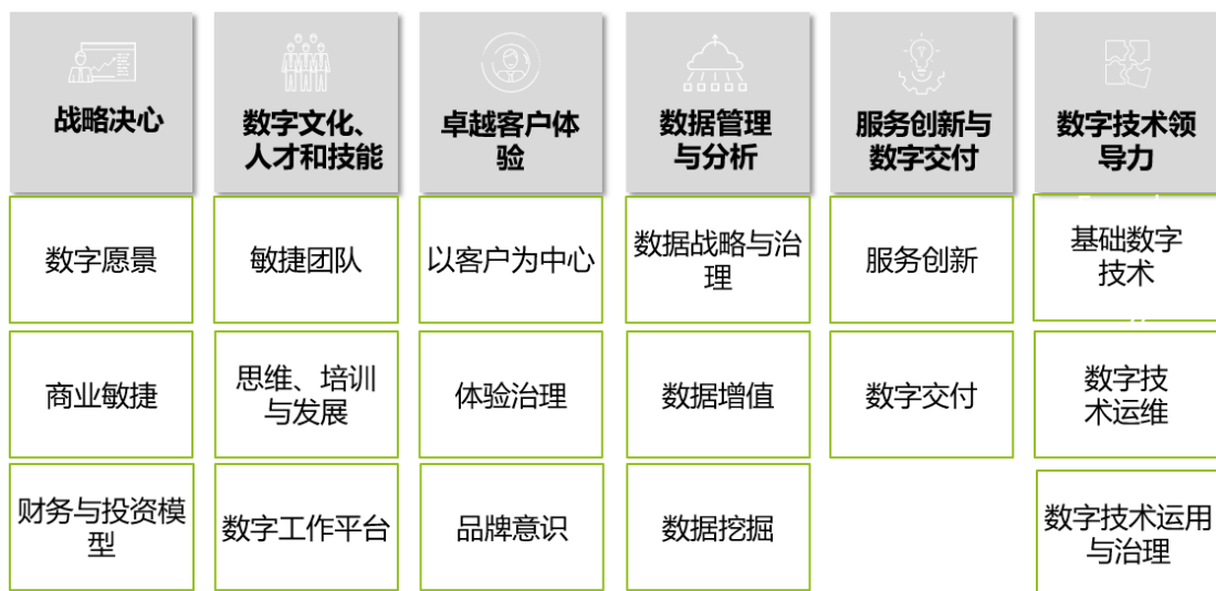
Figure 4 ODMM 数字化转型成熟度模型