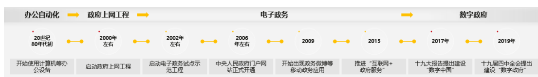
Figure 1 我国政府信息化发展历程

我国政府信息化建设经历了办公自动化、电子政务、互联网+政务服务等发展阶段，目前正在快速进入政府办公、政务服务、社会治理、行业管理全面数字化的数字政府时代。